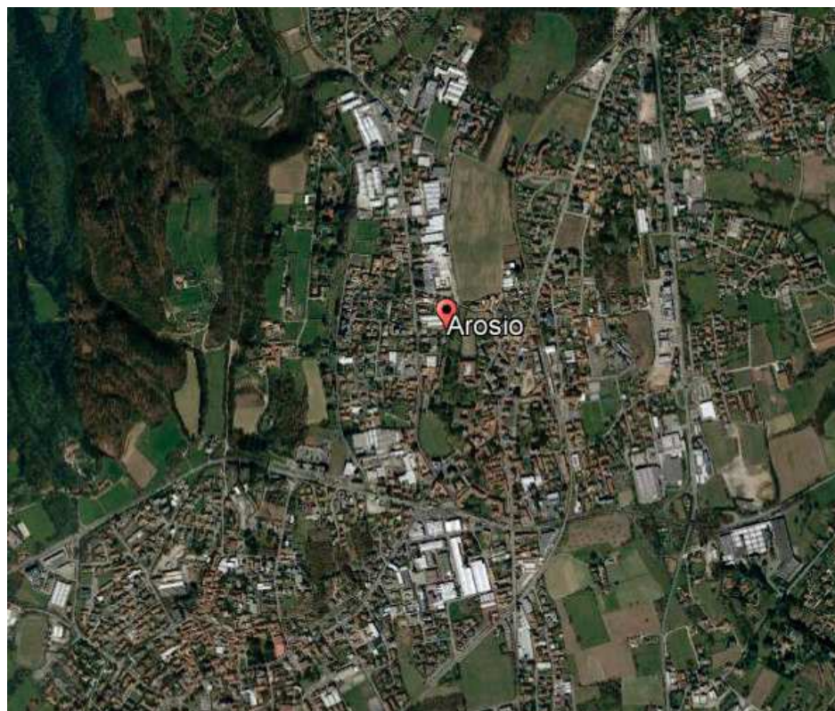
Figura 1: Ortofoto di inquadramento geografico